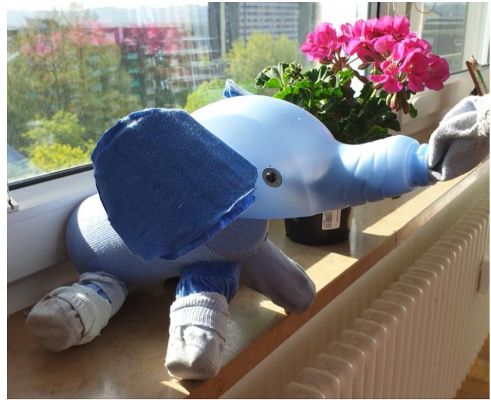
김효주 재활용 인형 작품