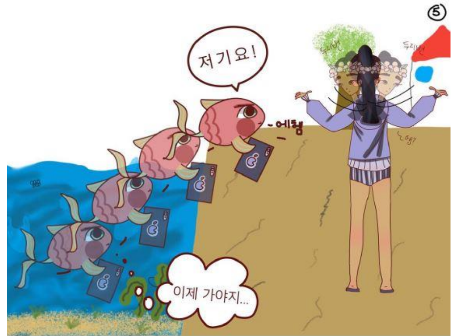
독일 비스바덴 김하림 천지윤